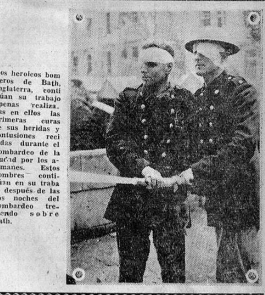
Dos héroicos bomberos de Bath, Inglaterra, continúan su trabajo apenas realizadas en ellos las primeras curas de sus heridas y contusiones recibidas durante el bombardeo de la ciudad por los alemanes. Estos hombres continúan en su trabajo después de los dos meses del bombardeo tremendo sobre Bath.

LONDRES, 12 UP. — Laval acusa a Jacques Doriot de intento de apoderarse del gobierno constituyente esto un indicio de que Alemania está descontenta con la administración Laval. En esferas diplomáticas se ha sabido que Doriot ardiente dirigente germánico fue denunciado por Laval al descubrir que estaba planeando un complot con apoyo alemán. Laval prohibió expresamente al partido de Doriot organizar reuniones políticas en la zona libre. Dicese que Laval discutió fuertemente con Doriot cuando éste sugirió que su partido debía armarse para pelearse contra los comunistas. (PASA a la Pág. 2, Col. 5)