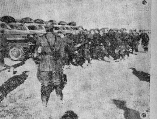
Esta fotografía enviada a Londres por radio muestra a un grupo de choferes rusos, bajo el mando de un comandante, que en la población de Andimishk en Persia se instalan en camiones americanos enviados para Rusia por la vía del Océano Indico y que van a ser conducidos a la URSS